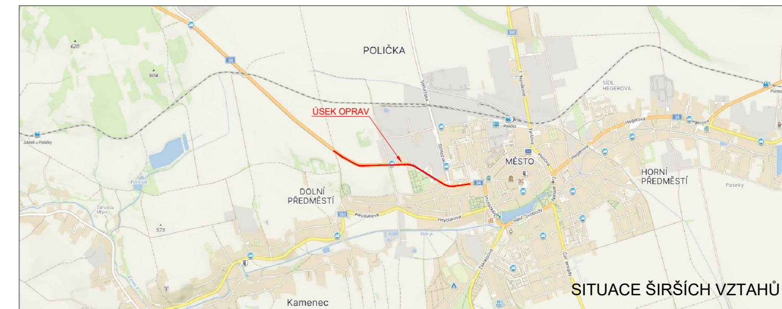
SITUACE ŠIRŠÍCH VZTAHŮ