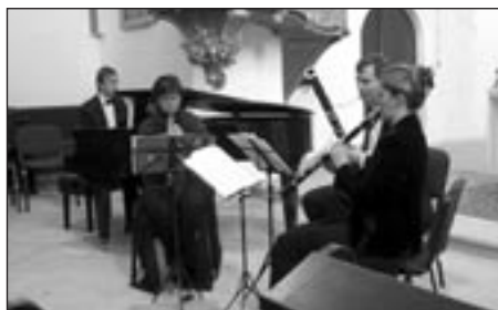
In Modo Camerale

Ověněno mezinárodními cenami je ArteMiss trio. Po odlehčené Mozartově skladbě zaznělo pohodové trio B. Martinů Bergerettes, ve kterém již zcela zřetelně zaznívá harmonizace a melodika, která pak charakterizuje celé jeho dílo. D. Šostakovič napsal své klavírní trio č. 2. v roce 1944. Je plně těžkostí oné doby, ale cítíme i tu šířku krajiny, ve které žijí válkou trápení, ale se svou