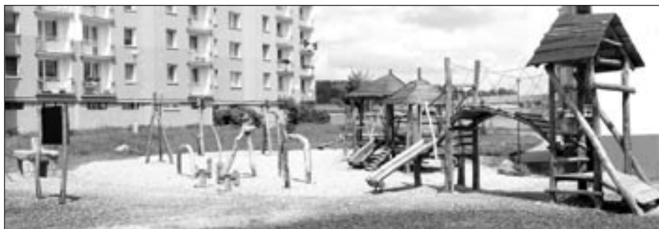
Ani „Jezerní říše“ nesplňuje všechny normy EU