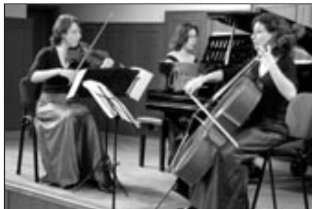
ArteMiss trio