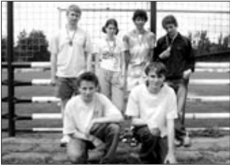
Úspěšná výprava dorostu v Ústí nad Orlicí

Květen s červnem jsou nejnabitějšími měsíci v termínovém kalendáři každého atletického oddílu, neboť se kombinují závody atletického svazu se školními atletickými závody. Pro poličské mladé atlety bylo toto období velmi úspěšné. Symbióza přípravy atletického oddílu při Masarykově základní škole a odpovědná práce vyučujících tělesné výchovy jsou pilíře, na kterých se rodí v tak špatných podmínkách tak dobré výsledky.