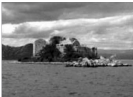
Ruiny věznice na Skadarském jezeru