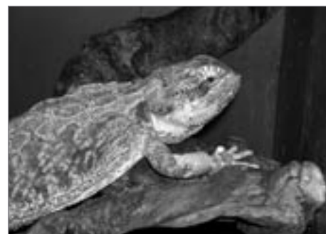
Agama vousatá z Austrálie