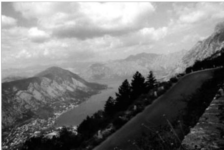
Pobled z lovčenských serpentin na záliv v Boce Kotorské

20. století největší stavba v monarchii. Úzká silnice je zařiznutá do úbočí a vlásenkovité zatáčky nutí seshora jedoucí automobily zastavit na místech, kde jsou zrušena kamenná nízkočká zábradlí - do těchto mezer se vklíní auto, aby bylo možno zesputa projekt. Cesta vedoucí do bývalého hlavního města Cetinji rozšířila seznam námi absolvovaných adrenalinových silnic. I současné bedekry takto o ní píš.