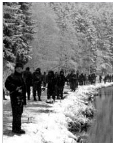
Vánoční atmosféru závodu vykouzlil napadlý sním

Oddíl MSKA Polička se umístil na 2. místě. K dosaženým úspěchům gratulujeme a přejeme mnoho dalších.