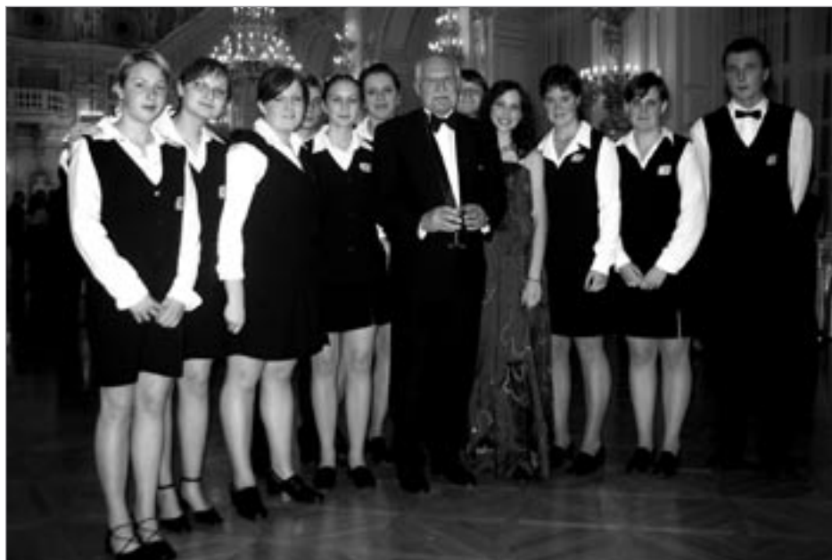
Hrad 2007- setkání s prezidentem V. Klausem

Dne 28. 10. 2007 byli poctěni vybraní studenti gastronomického umění chystáním rautu při vládní recepci na Pražském hradě. Náročný úkol splnili více než zodpovědně. Odměnou za jejich práci a únavu jsou jim neobyčejné zážitky plynoucí z atmosféry Hradu i ze setkání s jedinečnými