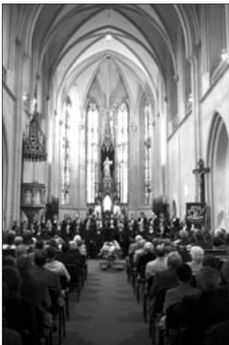
Závěrečný koncert v chrámu sv. Jakuba

Když poté zazněl jeden z Dvořákových Slovan-ských tanců, přinášející klid a zamyšlení, zavzpomí-