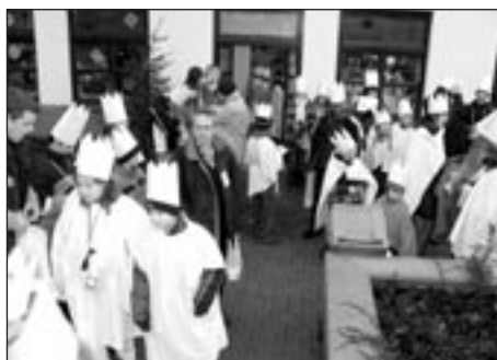
Odchod od stacionáře