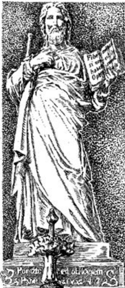
Sv. Jakub na oltáři kostela v Poliče. Kresba: PhDr. O. A. Kukla

- tak jej při návštěvě jeho atelieru charakterizoval sám papež Pius IX.). A právě na tohoto umělce padl po menším zaváhání v Poliče los. Zejména dopisy z r. 1862, jež jsem zároveň ještě s jinými kdysi objevil ve zdejších městském archívu (viz mou studii „Sochaři Polička“ z r. 1958) dokládají vděčnost, kterou sochař projevil purkmistru Smolovi, když obdržel jeho nabídku jako vítaný příslib zlepšení finanční situace. Šlo mu však zároveň o víc: o ztělesnění myšlenek harmonie a smíření, o „pax Dei“,