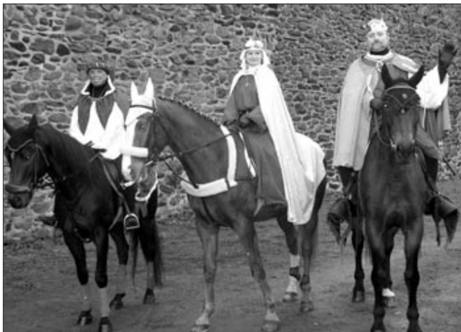
Tříkrálová královská jízda