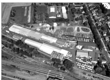
Letecký pohled z roku 2017

V únoru 1989 vypukl požár v prostoru lakovny, která i s přilehlým skladem hotových výrobků vyhořela; škoda byla mnohamilionová, neboť ve skladu bylo mimo jiné zničeno i několik tisíc vojenských beden. V této situaci podnik „vstoupil“ do revolučního roku 1989.