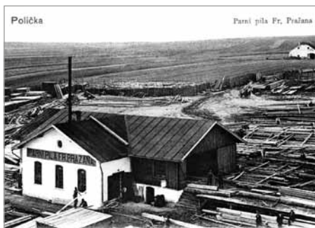
Pilnice v roce 1903