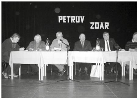
Pohled na předsednictvo