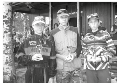
Vítězové v kategorii juniorů

„Přijelo sem 79 rybářů z blízkého i vzdáleného okolí. Aby byli spokojeni s úlovky, vysadili jsme 450 krásných pstruhů duhových ve váze od 0,3 do 1,1 kg a dále 520 kaprů kolem 50 cm, tedy kolem 3 kg. Počasí nám přeje a ryby berou. Mezi prvními je zatím