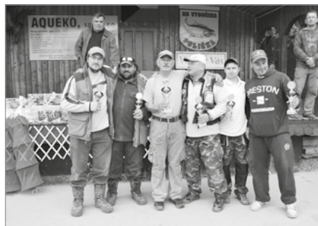
Na snímku jsou tři vítězné dvojice

V pátek 1. května oslavili poličští rybáři Svátce práce uspořádáním závodu Májový dvojboj. Přihlásilo se do něj 100 rybářů, sdružených do 50 dvojic. Soutěžilo se ve dvou kategoriích – kapr a pstruh. Závodníci mezi sebou svedli krásné souboje, celkem ulovili neuvěřitelný počet 2 305 ryb, z toho 555 kaprů a 1 750 pstruhů.