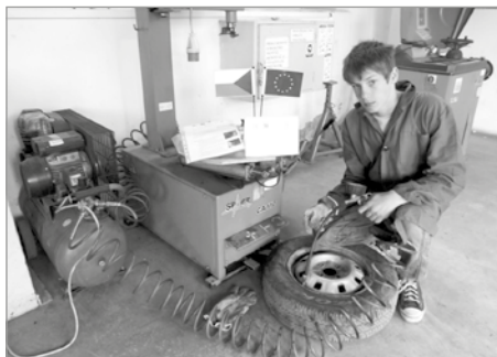
Žák na pracovišti oboru – automechanik

Vycházející žáci z 8. a 9. ročníku jsou už přijati na tříleté učební obory – cukrář, zámečnick, zahradník, tesař a klempíř. Většina obor zdárně ukončí a může se ucházet o zaměstnání. Přípravě na volbu povolání se věnujeme už od 6. ročníku. Spolupracujeme s úřadem práce, výchovnými