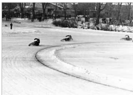
Ledová plochá dráha 1979 před televizními kamerami