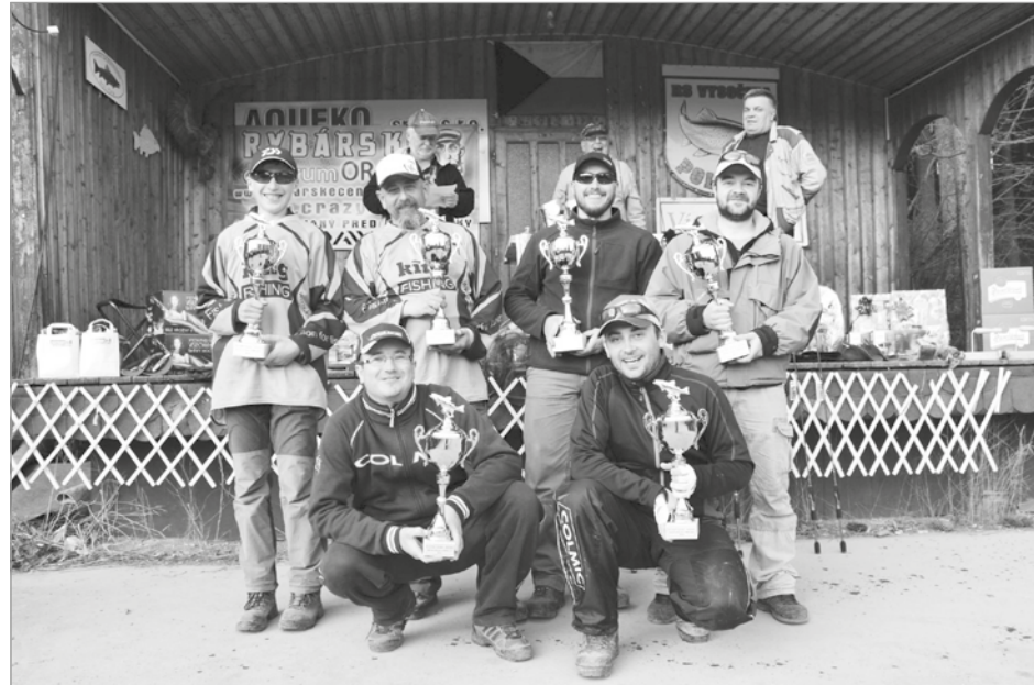
Vítězové závodu Poličský duhák při přebírání pohárů a věcných cen

skvělá, všude vládla dobrá nálada a pohoda. Na každém kroku bylo znát, že celková úroveň, a to nejen pokud jde o rybářské umění, ale též o „obyčejná“ lidská přátelství a vzájemný respekt, byla vysoká. Ryby velmi dobře braly, a to po celý závod, celkem se jich ulovilo 3 232. Jako staromódní rybář nemohu pochopit, že za pouhé čtyři hodiny čistého lovu lze ulovit téměř polovinu nově vysazených ryb. Pokud se nemýlím, nebylo při podobných jarních akcích v letech minulých dosaženo lepšího výsledku. Svědčí