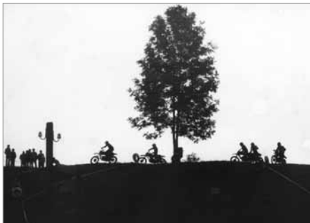
Motokros MR ČSR 1985