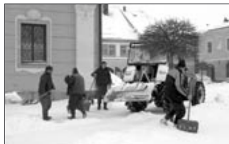
Pracovníci T.E.S. při ručním dočišťování