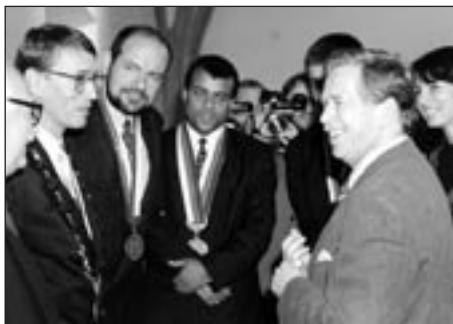
Setkání starostů a primátora s prezidentem ČR Václavem Havlem při příležitosti zabavení Dní evropského dědictví v Kutné Hoře 1996

V oblasti propagace je velice významným partnerem sdružení cestovní kancelář ČEDOK , s nímž se ČI účastní mezinárodních veletrhů cestovního ruchu (Berlín, Londýn, Utrecht, Moskva a další). Čedok prezentuje členská města ve svých inkomingových katalozích a poté do těchto měst vozí své klienty. Důležitým partnerem ČI je také Agentura Jitro , která prezentuje krásy našich měst v několika infocentrech v historickém centru Prahy. Velice přínosným počinem pokračování na str. 2