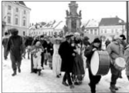
Masopustní průvod vyrazil z náměstí do ulic města