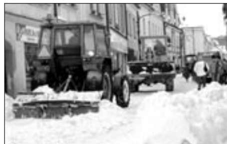
Při úklidu sněhu pracovala i těžká technika