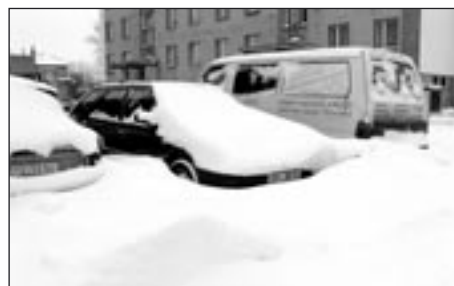
Řidiče trápí závěje sněhu na parkovištích