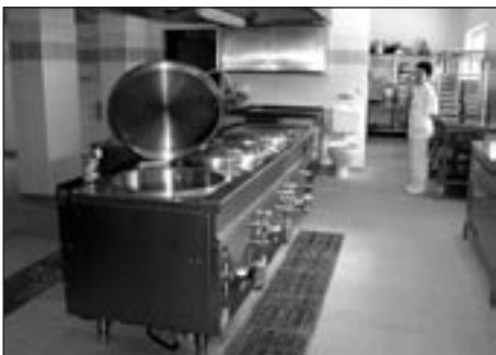
Nová kuchyně září nerezem a novotou

Zhotovitelem akce byla společnost VCES, a.s., autorem projektu rekonstrukce a dostavby stravovacího provozu AZASS je projekční