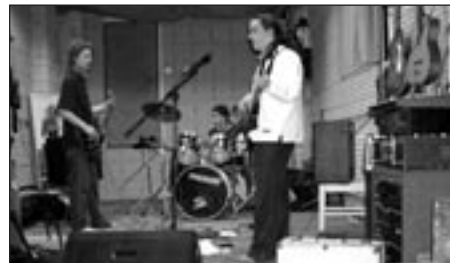
V nové zkušebně zkusí poličská kapela Bio-nafta

19. února se v Divadelním klubu uskuteční soutěžní přehlídka regionálních kapel Poličský Skřivan 2005. Akce je zaměřena jako prezentace hudebních těles a zároveň jako prostor pro začínající kapely a hudebníky. Akce je přístupná pro jakoukoli kapelu hrající jakýkoli žánr. Vítězové dostanou možnost vystoupit na letošním Rockování. Mohou tak své umění prezentovat na renomovaném festivalu a získat mnoho nových fanoušků. Hodnotit je bude odborná porota v čele se známou osobností, která je však ještě v jedné. Aby měly kapely kde zkusit a později snad i nahrávat svoje demo ukázky, zřídili divadelníci v klubu zkušebnu se základním vybavením. Zkušebna je přístupná všem zájemcům po dohodě v Divadelním klubu.