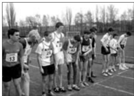
Poličští atleti startují do nového roku

11. prosince 14. ročník Vánočního běhu Parníkem v Č.Třebové.