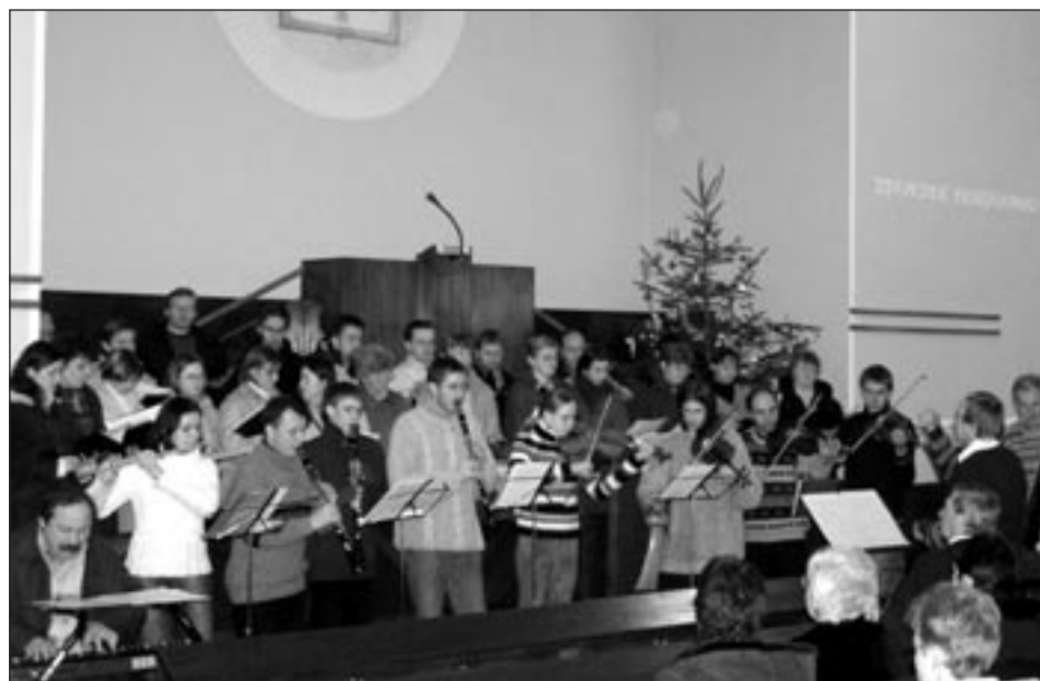
Benefiční koncert proběhl 17. prosince v Evangelickém kostele v Poličce