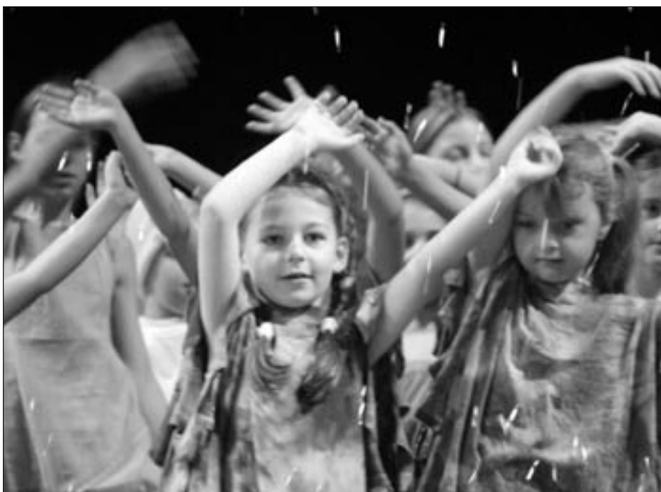
Nejmenší účinkující z tanečního oboru ZUŠ Bohuslava Martinů při závěrečné „děkovačce“ představení „Ta naše písnička česká aneb bezky český“