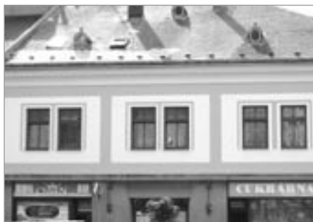
Nová fasáda cukrárny