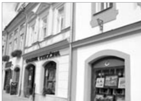
Opravené domy městského úřadu