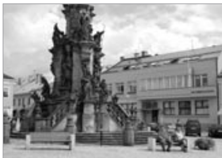
Spořitelna a morový sloup