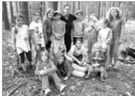
Naše nejmladší děvčata v lese

Družstva přípravky, minipřípravky a přehazované letos ukončila sezónu poslední červnové pondělí na volejbalových kurtech. K vidění byla celá řada kreačí s míčem jak plážová, tak antuková - zajímavé mače s rodiči, dle pravidel barevného minivolejbalu. Závěrečné buřty všem chutnaly.