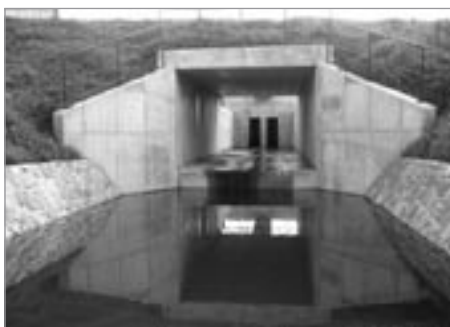
Nově vybudované hrázní těleso, sloužící jako výpust' rybníka a současně jako bezpečnostní splav pro dvěstěletou vodu.

zásadní opravy technických zařízení na hrázi – výpustě a bezpečnostního splavu.